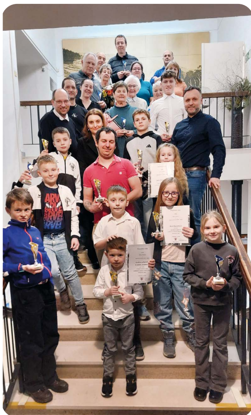
Společná fotografie oceněných sportovců. Více fotografií na webu nebo facebooku města.