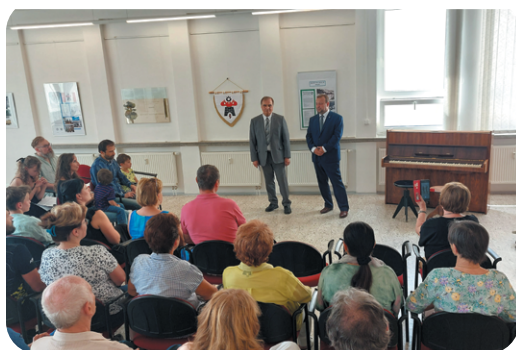
Vernisáž výstavy Střípky z historie Adamova.