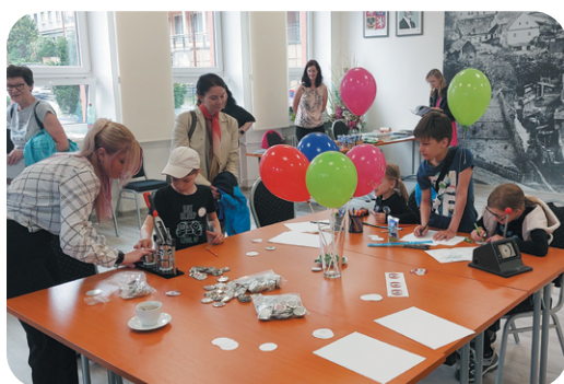
Dny otevřených dveří města Adamov Městský úřad Adamov.