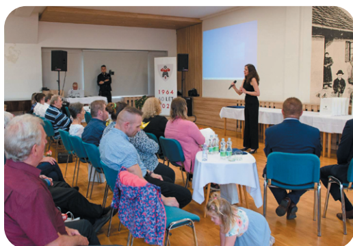
Slavnostní předání ocenění čestného občanství, titulu osobnost města a pamětních listů.