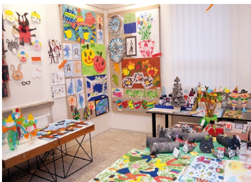
Salonek dětských adamovských umělců