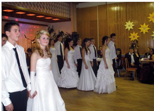
XIII. školní ples