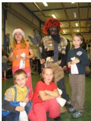
Mikuláš v MKM