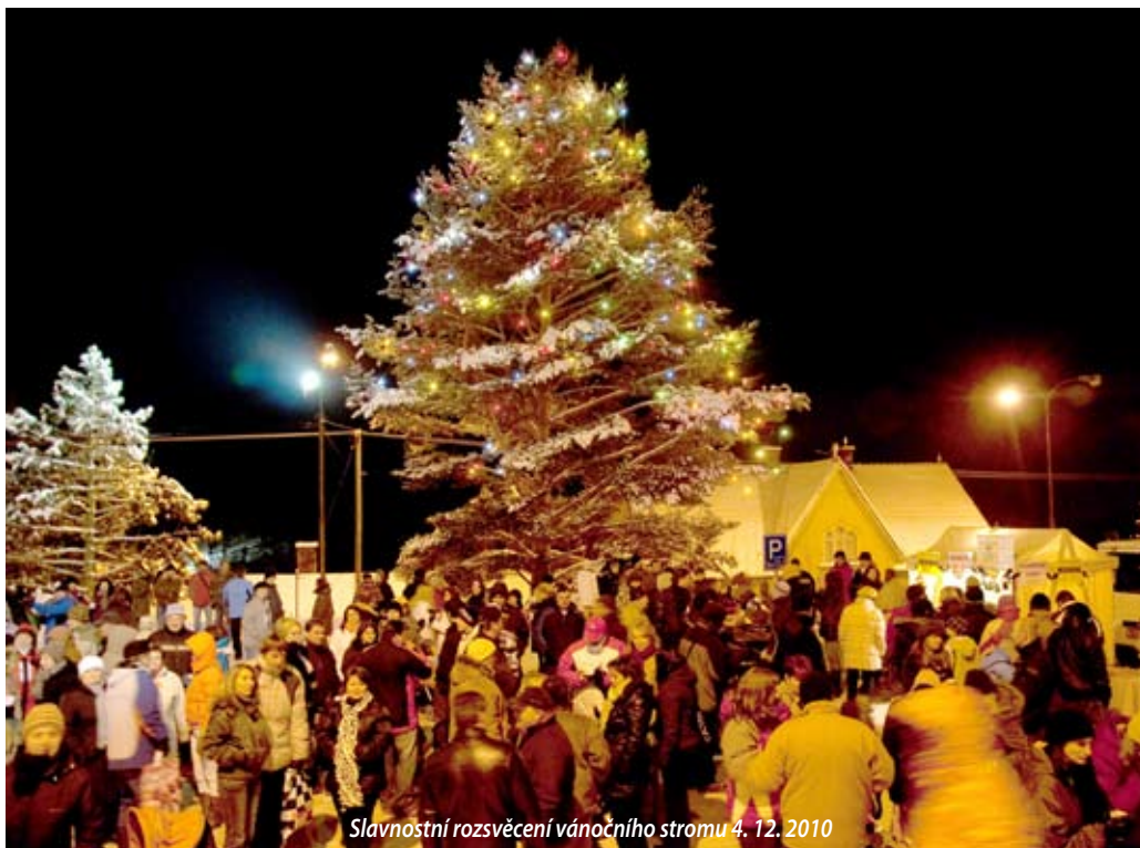
Slavnostní rozsvěcení vánočního stromu 4. 12. 2010