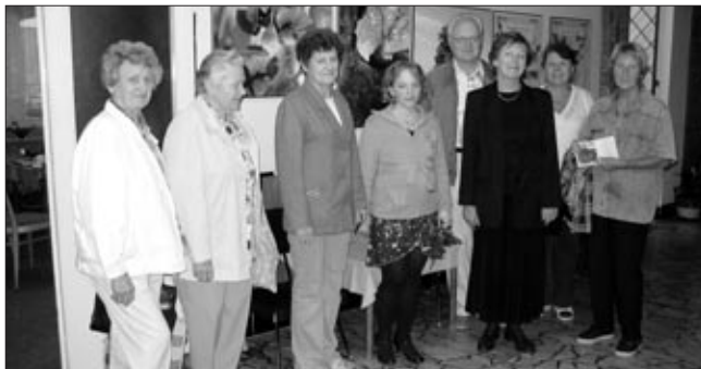
Prvními návštěvníky výstavy „Jedinečnost stromů“ byli účastníci besedy k akci „Strom roku 2007“.