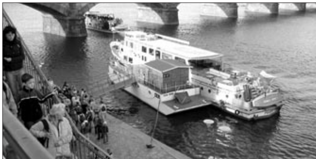
Fotografie ze zájezdu do Prahy „JINDY, JINAM, JINAK“.