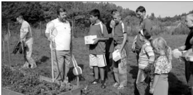
Jezíрко u Soběšic bylo cílem výletu pro děti i dospělé, které zajímá příroda a všechno, co s ní souvisí.