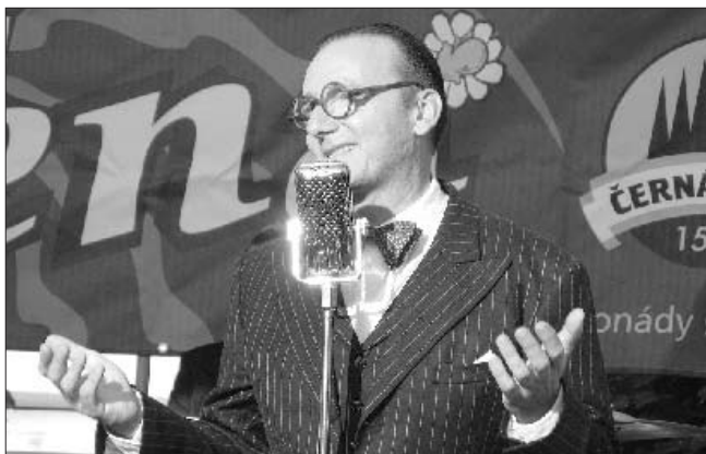
Příjemný podvečer prožili návštěvníci koncertu Ondřeje Havelky v Lysicích.