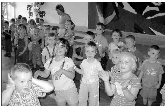
Takto vesele se děti loučily s pohádkami v červnu 2007.