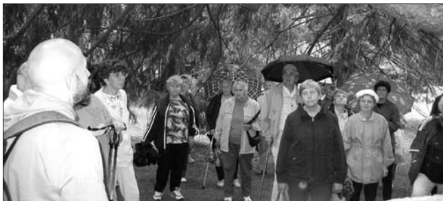
Fotografie z vlastivědného výletu do Moravského krasu.

Na obě akce je nutno se přihlásit do 15. června (do tohoto termínu máme vstupenky rezervované).