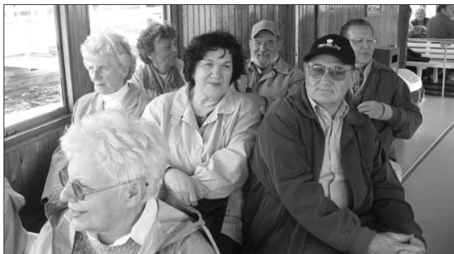
V rámci exkurze Zadním vchodem do DPMB jsme se seznámili s historií i současností lodní dopravy v Brně. Závěr exkurze patřil návštěvě hradu Veveří.