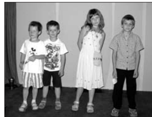
26. 5. jsme zahájili sérii akcí pro děti k MDD. Ta první patřila návštěvě Malé scény Mahenova divadla v Brně.