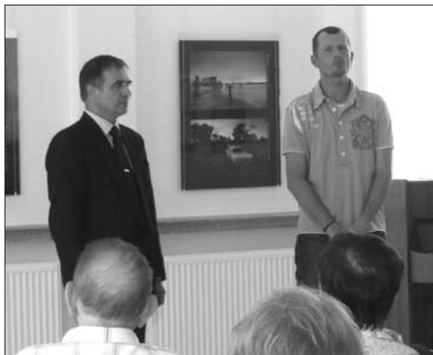
Květnová výstava nazvaná „Hlavou dolů“ přiblížila návštěvníkům práci fotografa Petra Soukupa.