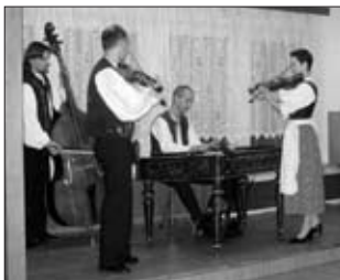
KONCERT CIMBÁLOVÉ MUZIKY DRAHAN – Příjemný podvečer přžili všichni návštěvníci koncertu cimbálové muziky Drahan. Právě díky výbornému publiku trval koncert dvě a půl hodiny!