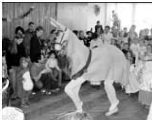
DĚTSKÝ KARNEVAL – letošní karneval opět přivítal řadu různých a krásných masek. O bohatou tombolu se postarali sponzoři, kterým tímto ještě jednou DEKUJEME!

U příležitosti akce BŘEZEN MĚSÍC KNIHY A INTERNETU bude po celý březen probíhat AMNESTIE UPOMÍNEK . Pro čtenáře knihovny je dále připravena akce PŮL HODINY NA INTERNETU ZDARMA .