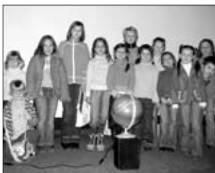
NEPOSEDNÍ KOSMONAUTI V PLANETÁRIU V BRNĚ – tentokrát jsme se spolu s dětmi vydali za pohádkou do brněnského planetária. Řada dětí byla v těchto prostorách poprvé a pohádky na nebi plném hvězdiček se jim moc líbily.