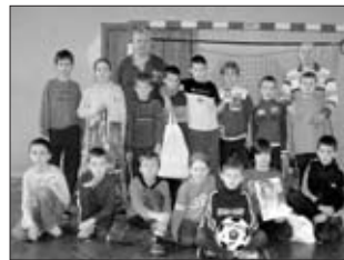
FK Adamov, družstvo přípravky 2. místo v šestém ročníku turnaje O putovní pohár starosty města Adamova