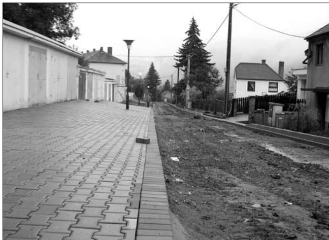
Horní část ulice Fibichova začíná dostávat svoji finální podobu.