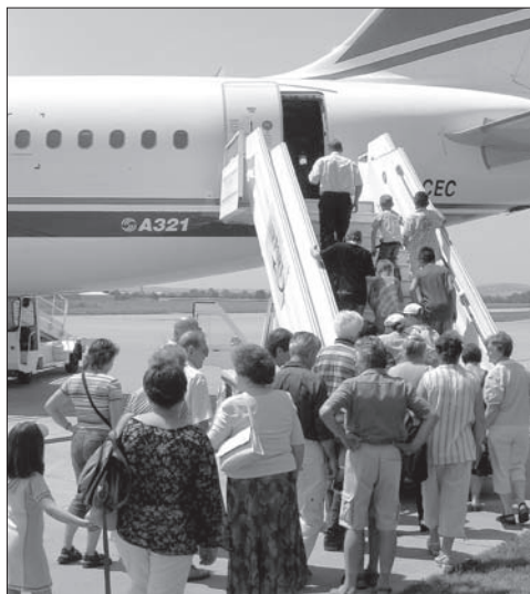
Červencová prázdninová exkurze nás zavedla na návštěvu letiště v Brně-Tuřanech.

Farní úřad v Adamově oznamuje, že s platností od 4. září 2006 budou bohoslužby v pracovních dnech začínat opět v 18.00 hodin. Jiří Kaňá