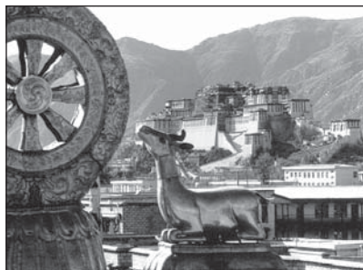
Lhasa – pohled na palác Potála

hlavním záměrem bylo ukázat podivuhodný svět tibetského buddhismu ve dvou rovinách: zachytit nejen historický vývoj uměleckých památek, architekturu klášterů a chrámů, sochy, kultovní předměty, ale i podivu-