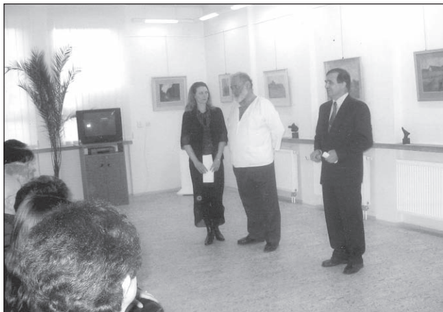
Vernisáž výstavy J. Holáska 16. ledna 2005

□ 17. února Městské divadlo Brno muzikál ZAHRADE DIVŮ přihlášky do 31. 1. 2005, 18 hod. Cena zájezdu: 410 / 220 Kč