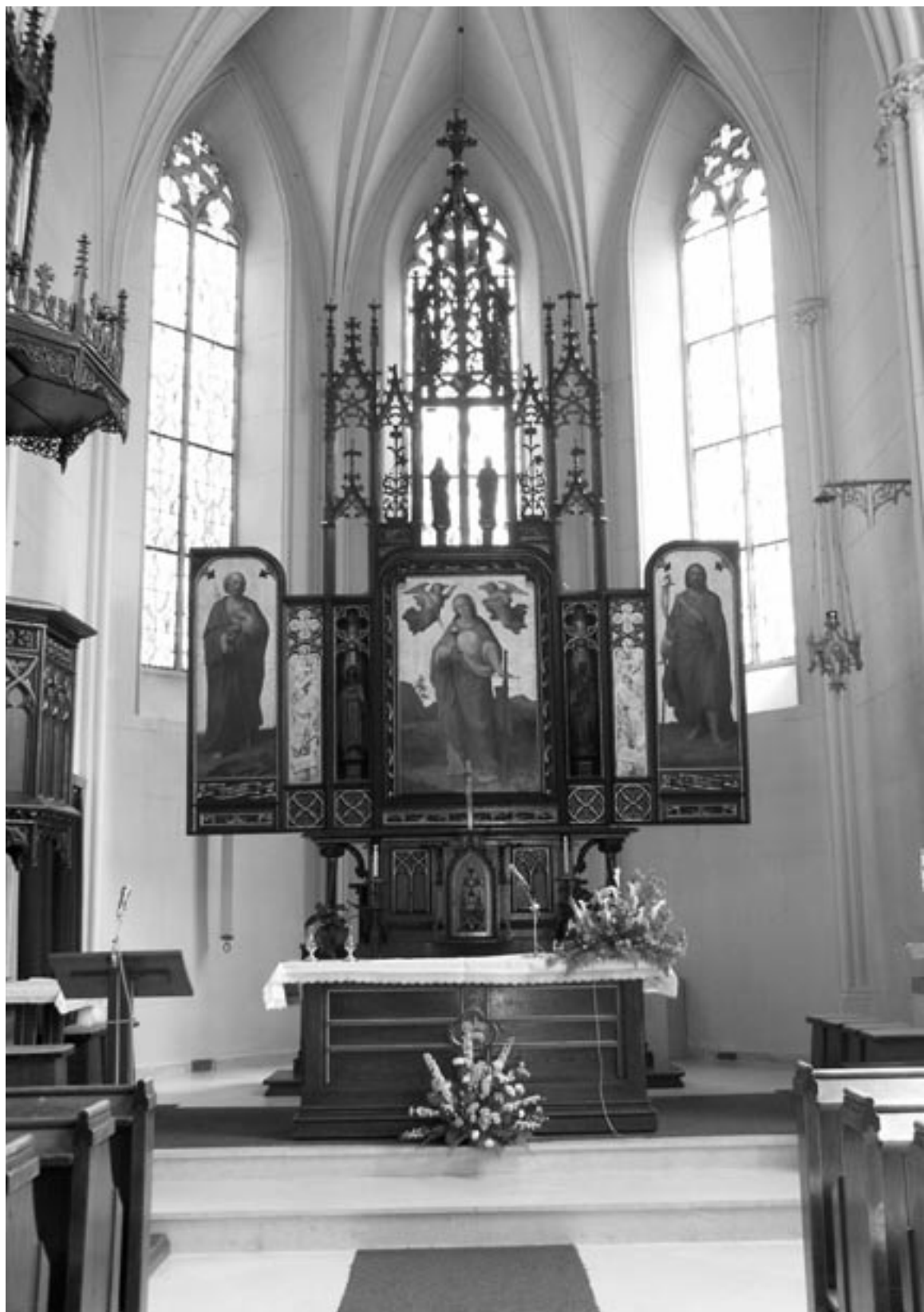
Hlavní oltář v kostele sv. Barbory v Adamově.