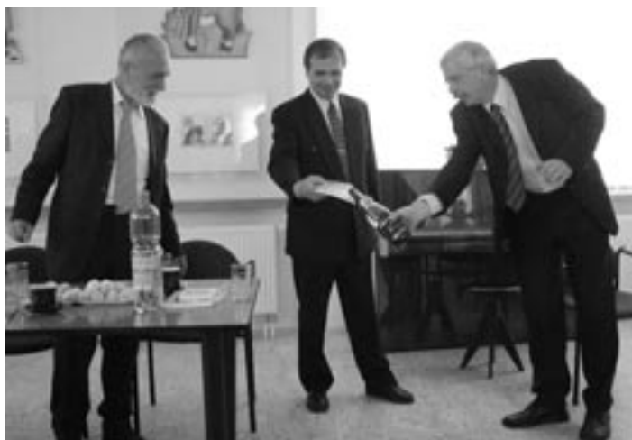
Z oslav povýšení Adamova na město – Křest knihy "Adamov ze starých pohlednic"

Výstavu můžete navštívit denně v době od 13 do 17 hodin.