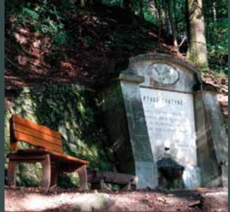
Adamov - krajem lesů a studánek