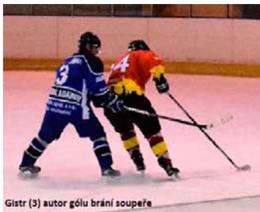
Gistr (3) autor gólu brání soupeře

Na začátku třetí části soupeř vyrovnal a začínalo se nanovo. Znovu jsme dali šanci soupeři v podobě dvou přesilových her. Ubránili jsme je, ale ... V 53. minutě šel soupeř do vedení z náhodné akce, kde obrana zapomněla na volného hráče. Neustále jsme vytvářeli tlak, zejména první pětka. Soupeř se nemoohl často dostat ze třetiny a s vypětím sil držel jednobrankové vedení. Trenér čekal na přerušení hry, ale soupeř hrál zkušeně a nedovolil to. Šance na odvolání našeho brankáře přišla při zámku v útočném pásmu necelých 36 vteřin před sirénou. To bylo málo času a již nezbylo mnoho sil. Po náhodně vytečovaném puku si jej našel soupeř a skóroval do prázdné branky. Důvod prohry v dobře rozehraném zápase je zřejmý. Nedisciplinovanost hráčů a velký počet vyloučení. První pětka splnila to, co po ní bylo požadováno. Dalším faktorem neúspěchu je slabý výkon druhé pětky, která si nebyla schopna vytvořit tlak, ale ani si pořádně přihrát. Třetí pětka splnila své úkoly. Ale jako celek jsme propadli.