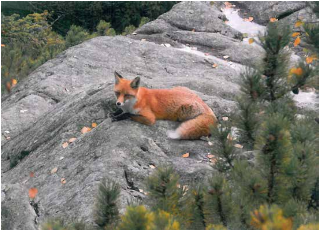
Vítězná fotografie ze soutěže Dovolená 2019.