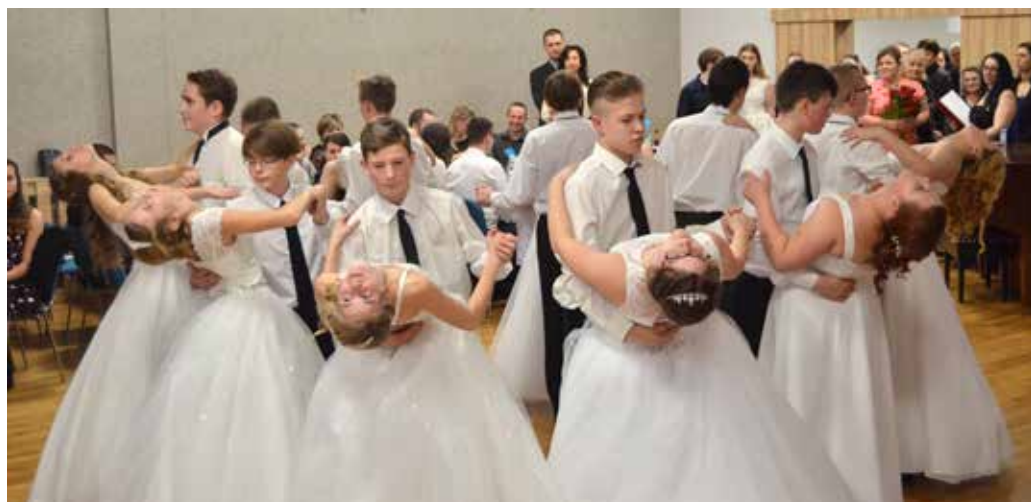
Fotografie z předešlého ročníku