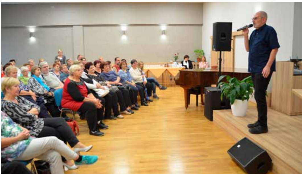
Káva o páté s Ivem Šmoldasem