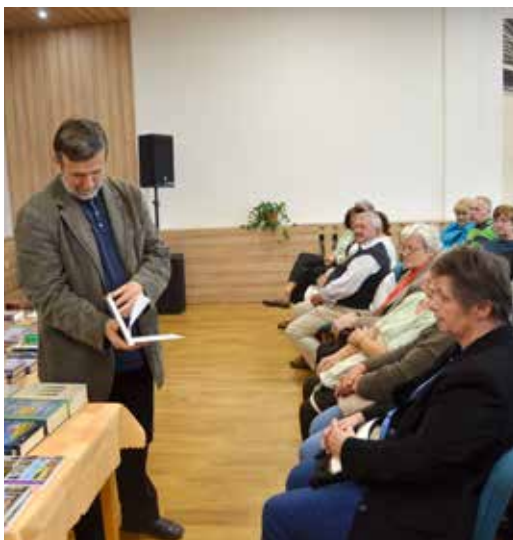
Beseda s autorem historických románů Vlastimilem Vondruškou.