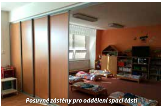
Posuvné zástěny pro oddělení spací části