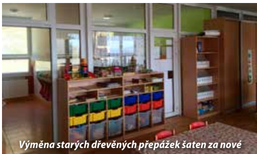
Výměna starých dřevěných přepážek šaten za nové