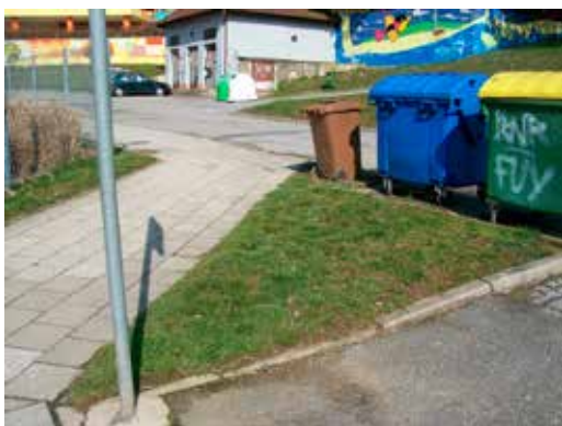
Nezpevněná plocha před opravou

Na základě přihlášky do Grantového řízení 2016 pro obce získalo Město Adamov z Fondu ASEKOL finanční podporu ve výši 9 000 Kč na projekt Zpevněná plocha pro stacionární kontej-