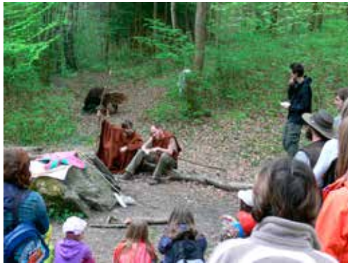
Den Země u Ptačí studánky