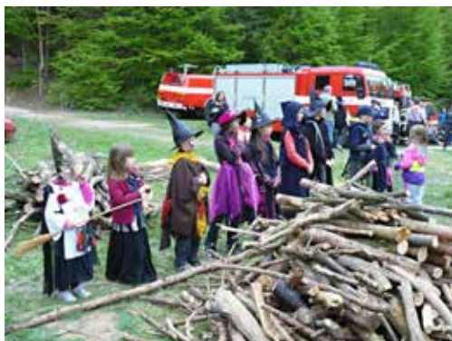
Pálení čarodějnic na skladáku 30. 4. 2015