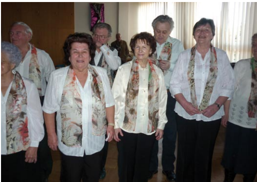
První setkání, kterým jsme si připomenuli hned tři výročí (50. výročí povýšení Adamova na město, 40 roků od slavnostního otevření budovy MKS a 10 let fungování Kroužku zpívání pro radost při MKS), se konalo v sále MKS v neděli 23. 2. 2014.