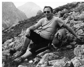
Vysokohorská turistika musela být. To byl ten správný namáhavý odpočinek.