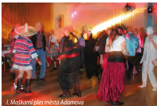
I. Maškarní ples města Adamova