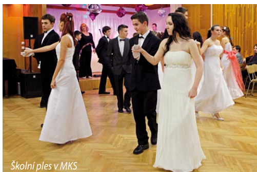
Školní ples v MKS