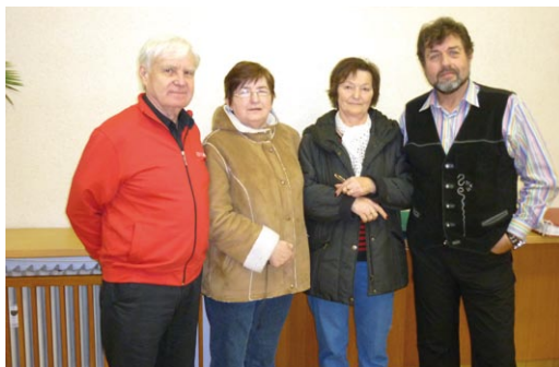
Setkání s oblíbeným hercem Zdeňkem Junákem.