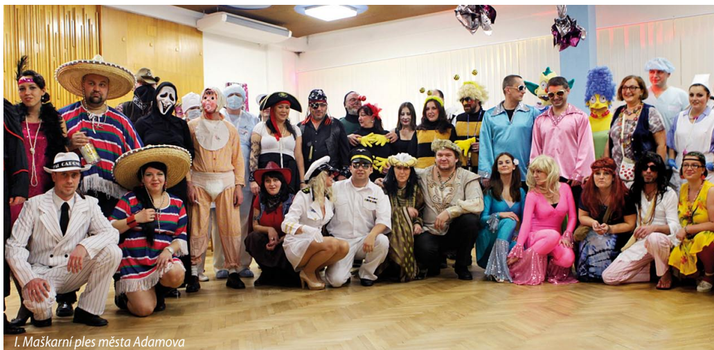
I. Maškarní ples města Adamova