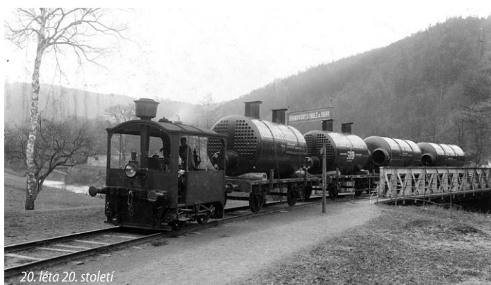
20. léta 20. století