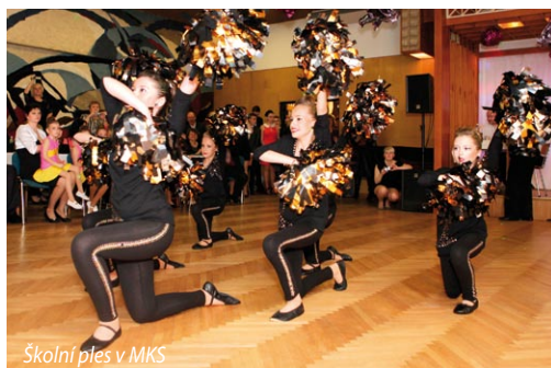
Školní ples v MKS