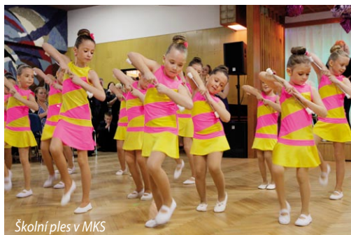
Školní ples v MKS