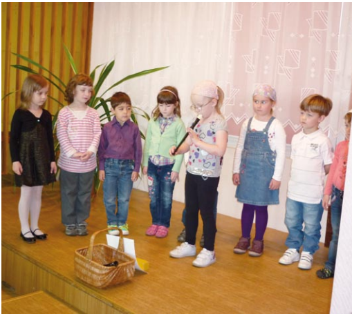
Svátek matek jsme si připomenuli při setkání, kde maminky a babičky pozdravily děti z mateřské školy na Komenského ulici.