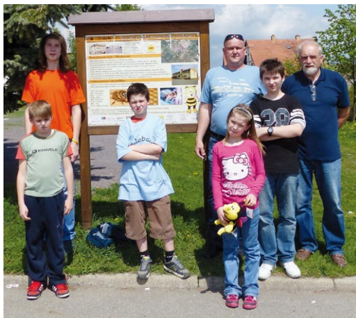
Zástupci z včelařského kroužku z Adamova na soutěži Zlatá včela vyfocení u prvního panelu naučné stezky v Mikulovících, která začíná u místní základní školy

Historie soutěže Zlatá včela je přibližně padesátiletá. Nová podoba soutěže přišla se společenskými změnami na přelomu osmdesátých a devadesátých let. Tradici těchto setkání začal ČSV v roce 2009, kdy se na SOUV v Nasavrkách sešli mladí včelaři z devíti zemí na prvním ročníku IMYB – International Meeting of Young Beekeepers. Doposud se soutěže s účastí našich mladých včelařů konaly ve švýcarském Zollikofenu 2010, rakouském Warthu 2011, 2012 v Praze, a v roce 2013 se uskutečnilo setkání v německém Münsteru. Jetiže v roce