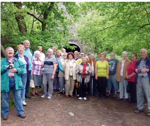
V rámci vlastivědného výletu jsme zavítali k Novému hradu u Adamova.

Hrají: B. Polívka, J. Somr, J. Pecha, I. Chýlková, B. Turzonovová, B. Seidlová ad.