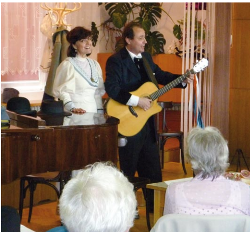
Vzpomínka na písničky pana Hašlera pod názvem Hašlerky představila našemu publiku Komorní divadlo Brno.