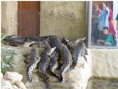
Krokodýlí farma Jevišovice

Soutěžící tak mohli získat maximálně 100 bodů. Soutěžilo se celkem ve dvou kategoriích, a to včelaříci 1.-5. třída a 6.-9. třída.