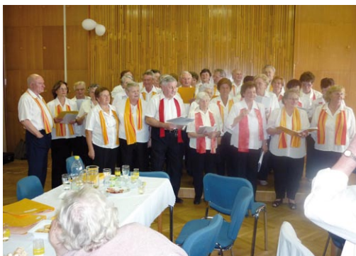
Návštěva přátel z Bratislavy