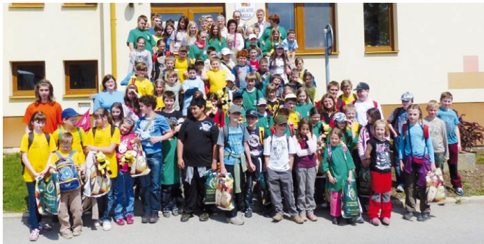
Účastníci soutěže Zlaté včely v Mikulovících u Znojma

Dne 4. 5. 2013 se uskutečnilo v Mikulovících u Znojma oblastní kolo vědomostní a praktické soutěže mladých včelařů, tzv. včelaříků – Zlatá včela. Cílem této soutěže je umožnit členům včelařských kroužků mládeže porovnání teoretických znalostí a praktických dovedností získaných při práci v kroužku a motivovat je k další činnosti v této oblasti. Tato soutěž je vypisována každoročně s možností postupu soutěžících do celostátního a následně mezinárodního kola.