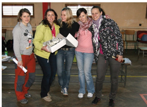
SMAJLICE vítězky turnaje žen