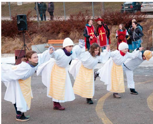
Masopust aneb karnevalové veselí