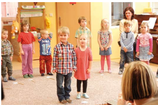
Vánoční besídka 2012