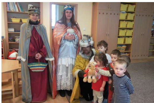
Tři králové 2013