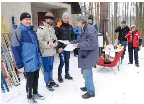
Lednový běh na lyžích (str. 18)