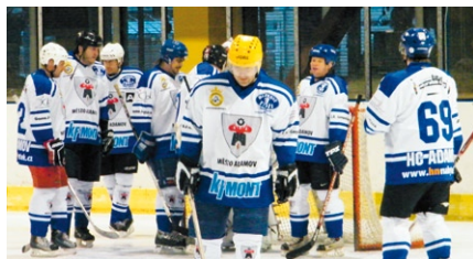
Válečná porada před začátkem