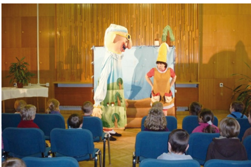
Lednové Dopolnedne s pohádkou – O Palečkovi