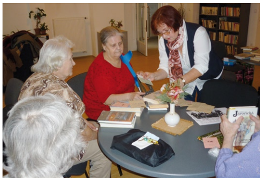
Z akce „Tato by se vám mohla líbit ...“ - setkání s obyvateli DPS a seniory u knižní nabídky