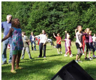
23. 6. – Komise PZMA a MA21 II. ročník Křížem krážem Adamovem Více na str. 4