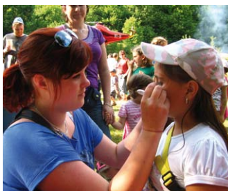
2. 6. – Rybářský svaz – MO MRS Soutěž v rybolovu u plavu Dětský den na Skladáku Více na str. 2