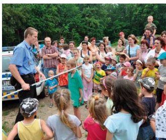
8. 6. – MKM Adamov Sportovní odpoledne, výtvarná dílna a „pokladovka“ v lese Více na str. 5