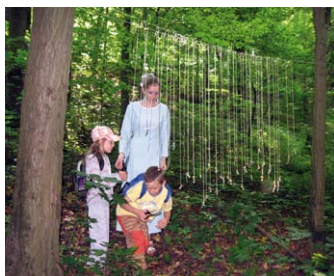
31. 5. – ZŠ a MŠ Adamov Den dětí – pohádkový les a hřiště sportovní den