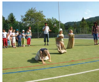
29. 6. – MKM Adamov Dětský den na hřišti Jilemnického – rozloučení se školním rokem Více na str. 5