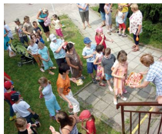
21. 6. – MKS Adamov „Červen patří dětem“ Více na str. 10