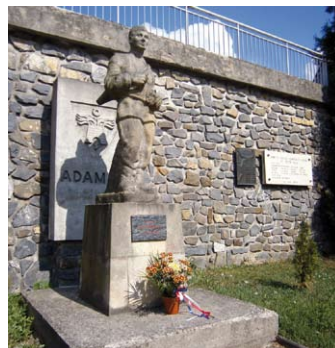
Den vítězství – kytice představitelů města