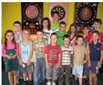
7. 6. – Šípkový klub Adamov Šípkový turnaj pro děti Více na str. 5