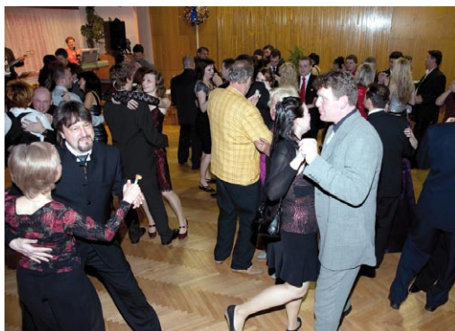
2. Ples města Adamova