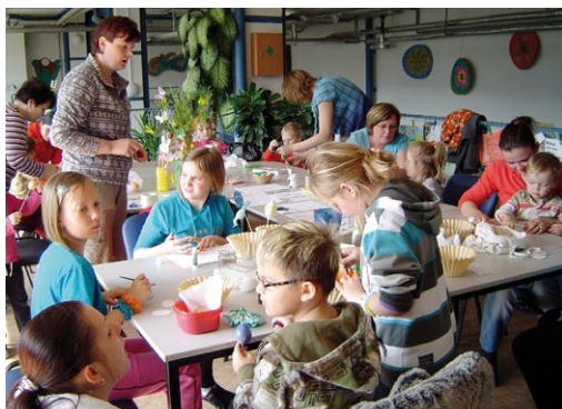
MKM – Velikonoční dílna