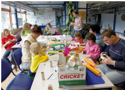
Recyklované tvoření ke Dni Země