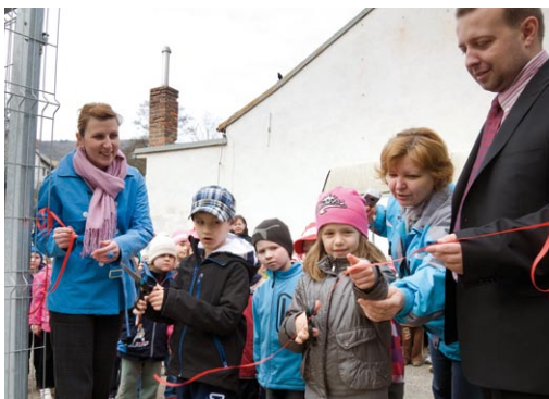
Otevření hřiště Mírová