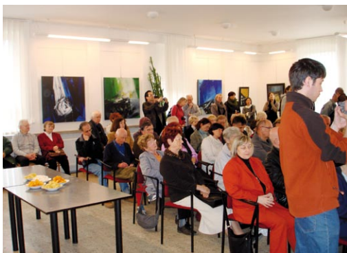
Výstava Miroslava Štolfy