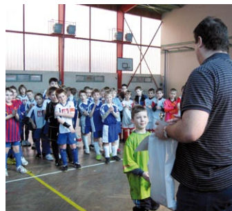
Nejlepší brankář a střelec turnaje