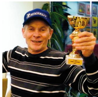
Kapitán mužstva veteránů Vespalec.

Už teď se všichni těší na příští ročník Veteránského turnaje.