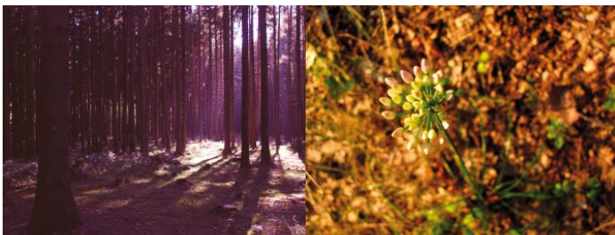
Fotografie Jany Hrubé, které obsadily 2. místo v soutěži Jaro v Brně (kategorie pod 15 let)