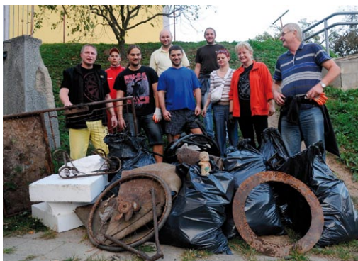
Za Adamov čistější