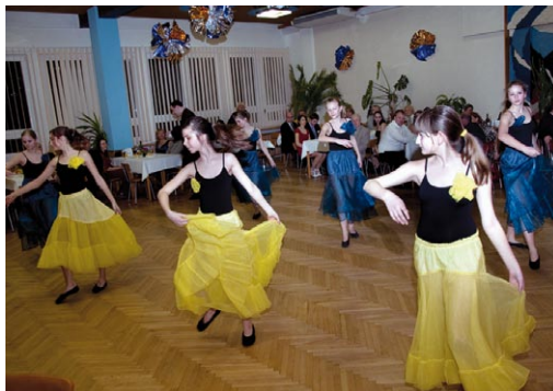
1. Ples města Adamova