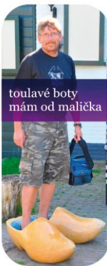
toulavé boty mám od malička

Začátek: v 17.30 hodin v salonku MKS Adamov, vstupné 30 Kč. „SEN UŽ NENÍ SNEM...“