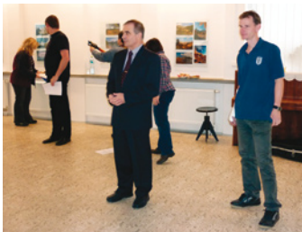
Letošní první výstava představila návštěvníkům fotografie adamovského fotografa Petra Masaryka.