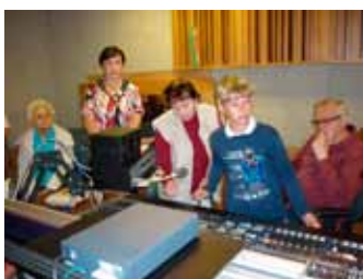
11/08/2011 Fotografie z exkurze do ČT Brno