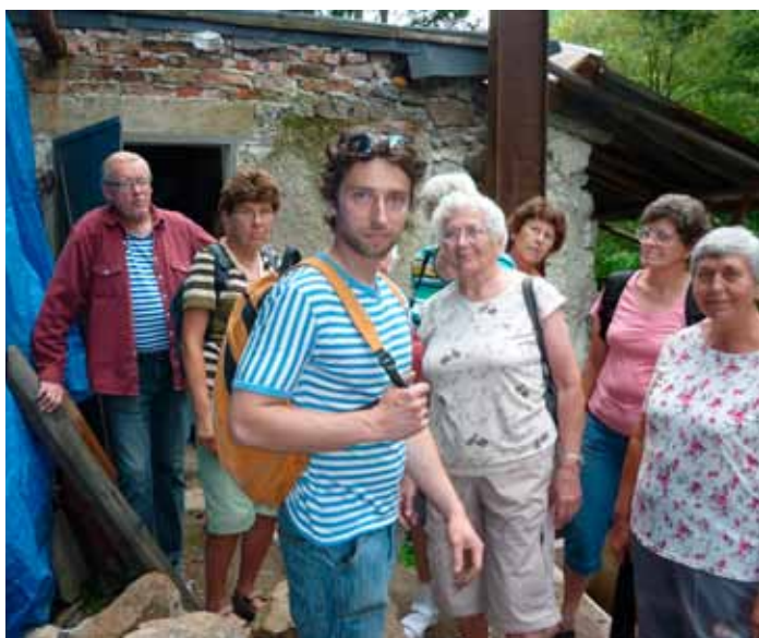
04/08/2011 Vlastivědný výlet na Cacovický ostrov