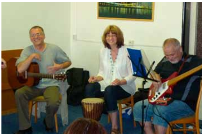
29/06/2011 Koncert sk. Genciána