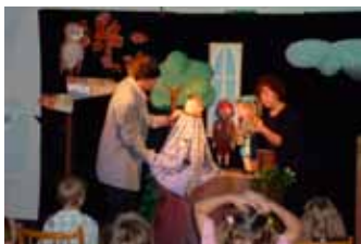
11/08/2011 Pohádkové prázdniny s divadlem Zlatý klíč