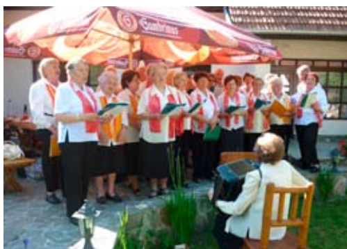
Foto ze setkání členů KD při MKS s přáteli z Bratislavy.