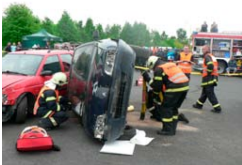
1. ročník soutěže JSDH