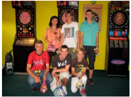
Ve čtvrtek 2. 6. 2011 proběhl v rámci oslav MDD v Šípkovém klubu Adamov turnaj pro děti a mládež ve dvou kategoriích do 15 let a od 15 let. V obou kategoriích se udělovaly ceny a poháry do šestého místa, pro zbytek byly připraveny ceny útěchy. Účast na turnaji byla dvakrát větší než v minulých ročnících.