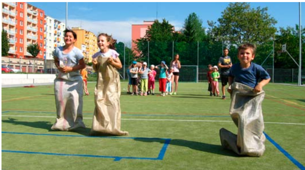
Den dětí v Adamově