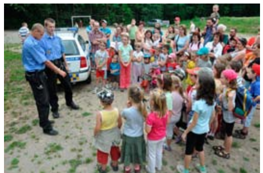
V pátek 3. 6. 2011 pořádal opět Městský klub mládeže dětský (pod)večer pro děti a mládež na hřišti nad školou Ronovská. Pro děti byl připravený zábavný program s ukázkami činnosti Městské policie, procházkou strašidelným lesem s hledáním pokladu a večer s ohněm, hudbou a občerstvením.