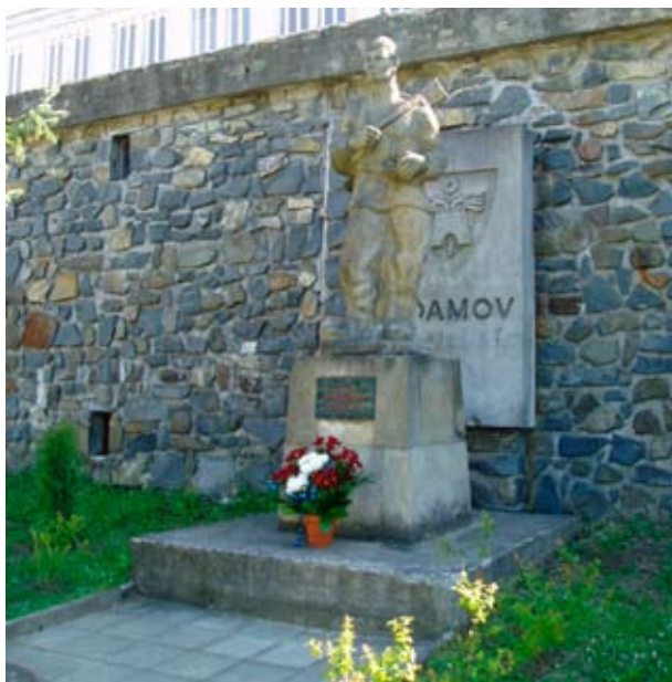
U příležitosti Dne osvobození zástupci města položili kytici k pomníku Rudoarmějce.