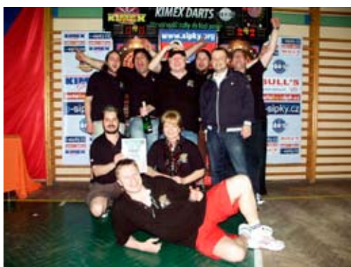
Adamovští šipkaři mistrem republiky