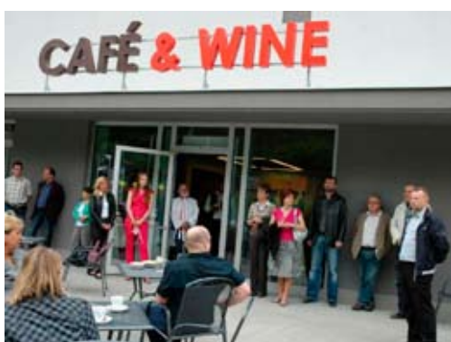
Slavnostní otevření a-centra