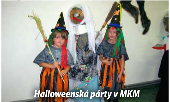
Halloweenská párty v MKM