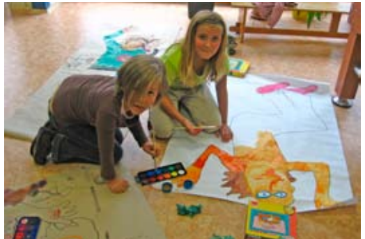
„Cestujeme po Evropě“ - obkreslování „obětí“ slavnými detektivy v Anglii