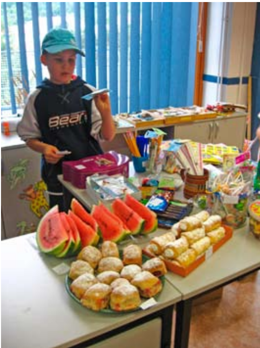
„Školní rok, ten se přečká...“ – zboží v klubovém obchodě bylo opravdu lákavé