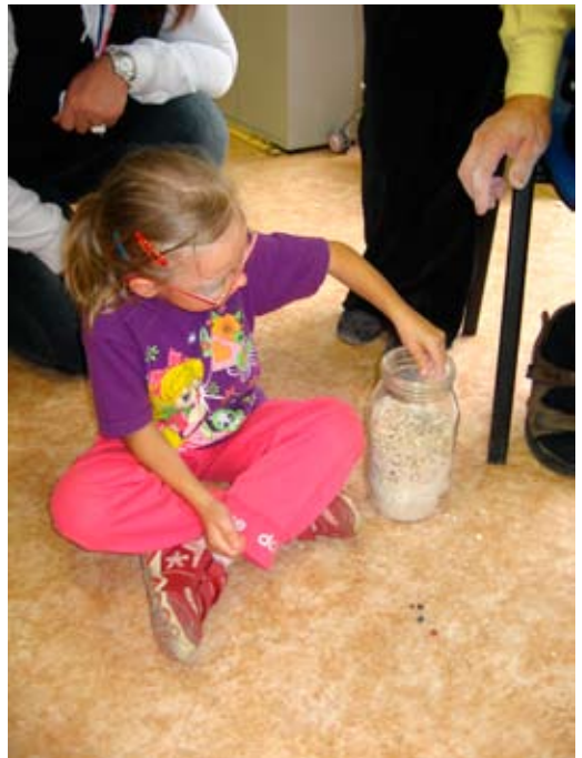
„Školní rok, ten se přečká...“ – hledání drahokamů