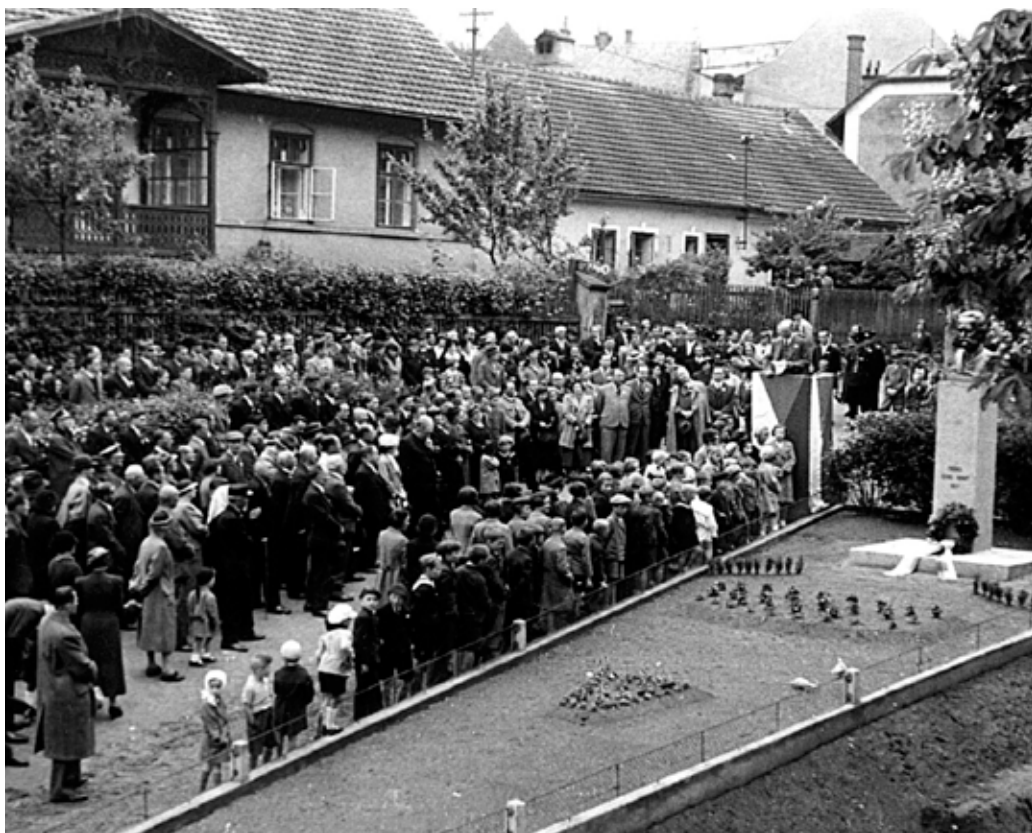
Busta Bedřicha Smetany na Smetanově náměstí. Fotografie ze slavnostního odhalení v roce 1937.