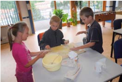
„Dožínky v MKM“ – tvorba chlebových placek