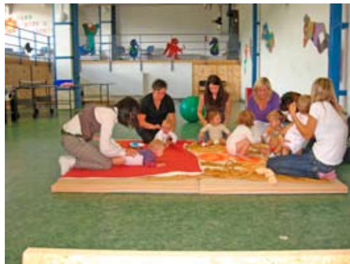
Čtvrteční cvičení maminek s dětmi