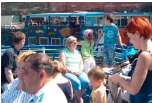
Fotografie z výletu do Prahy nazvaného „DO PRAHY ZA SPEJBLEM A HURVÍNKEM“

V říjnu 2010 bude soutěž vyhodnocena a všechny soutěžní snímky vystaveny v MKS.