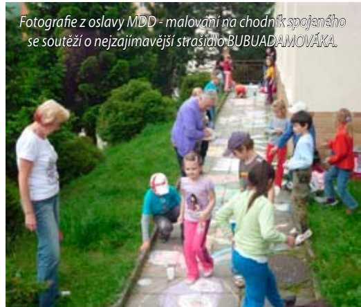
Fotografie z oslavy MDD - malování na chodník spojeného se soutěží o nejzajímavější stráždlo BUBUADAMOVÁKA.