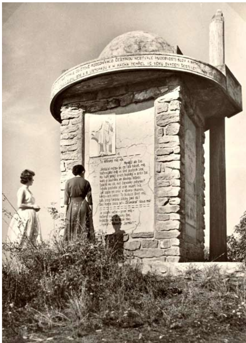
Máchův památník v 60. letech 20. století.