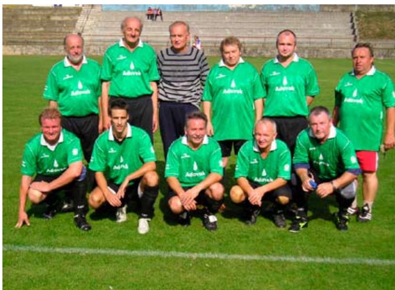
Turnaj starších pánů