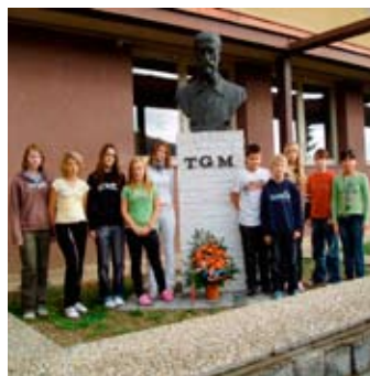
Dne 27. října 2009 byla členy žákovské rady ZŠ Komenského slavnostně položena kytička k bustě T. G. Masaryka, ku příležitosti Dne vzniku samostatného československého státu.

Předprodej jízdenek a vyřizování průkazek bude v Adamově zajištěno 15. prosince 2009 v době od 14 do 16 hodin.