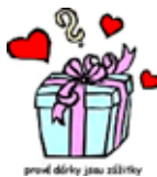
první dárky jsou zdarma

Jedná se o jednodenní (celodenní) návštěvu lázní Lednice, kdy zájemcům představíme tyto lázně, pro každého je připraven balíček procedur a dle zájmu bude zajištěna také prohlídka lednického zámku. Oběd - v lázních. V případě požadavku vám můžete připravit na tuto akci dárkovou poukázku.