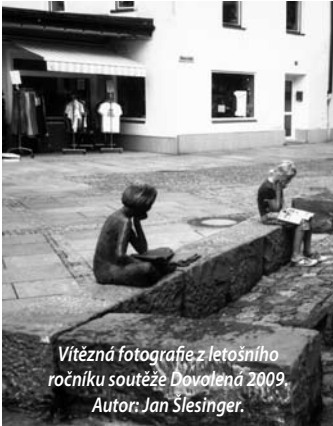
Vítězná fotografie z letošního ročníku soutěže Dovolena 2009.