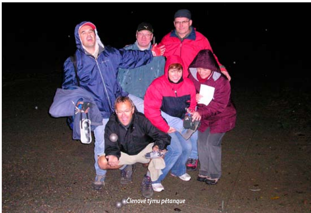
Členové týmu pétanque