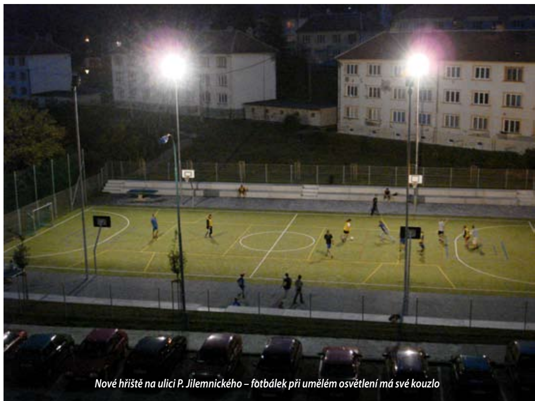
Nové hřiště na ulici P. Jilemnického – fotbalék při umělém osvětlení má své kouzlo