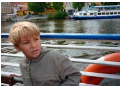
Čtyřmi fotografiemi se vracíme k poznávacímu výletu do Prahy pořádanému adamovským MKS. K dopravě jsme využili rychlovlaku Pendolino, památky navštívili v rámci procházky Prahou s příjemnou a vytrvalou průvodkyní - paní Dášou, navštívili ZOO v Tróji a odtud se do centra vrátili lodí. září 2009