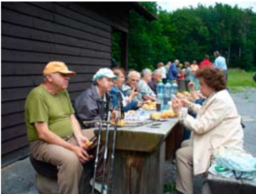
Výlet na Alexandrovku byl díky pěknému počasí spojen s obědem v přírodě...