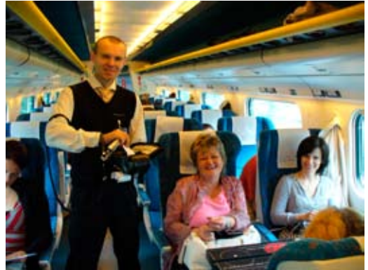
K návštěvě muzikálů v Praze jsme využili rychlovlaku Pendolino.