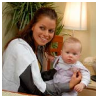
Hana Holišová v seriálu Velmi křehké vztahy