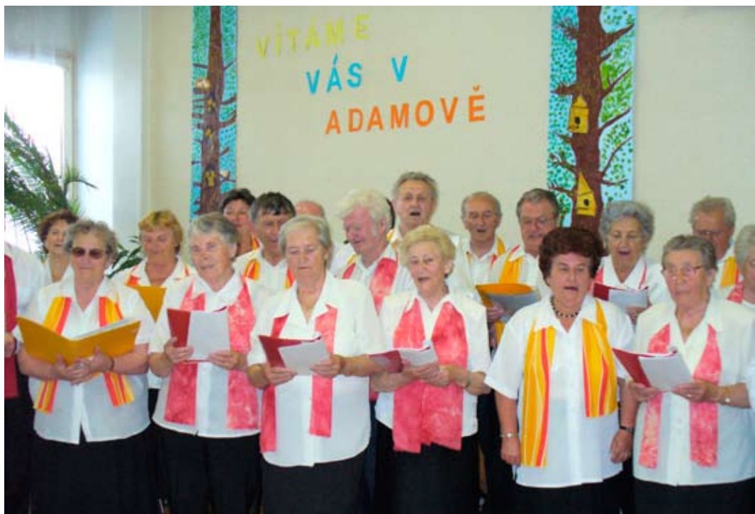
Ve čtvrtek 21. května t.r. zavítala do Adamova návštěva z Bratislavy. Členové klubu důchodců na Sibiřské ulici navštívili pivovar v Černé Hoře, mlékárnu v Otinovsi a ujít si nenechali ani chloubu našeho města - Světelský oltář. Odpoledne prožili ve společnosti našich seniorů a členů Kroužku zpívání pro radost při MKS.