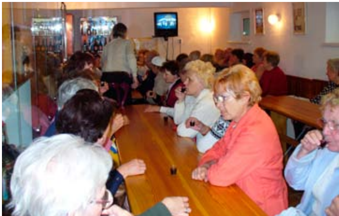
Pravidelné návštěvy výstavy Flora Olomouc jsme si zvykli spojit s návštěvou různých firem, podniků - tentokrát z vítězila Palirna u Zeleného stromu v Prostějově. Ekurze byla doplněna (ke spokojenosti všech) malou ochutnávkou výrobků.