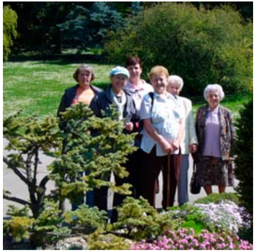
Fotografie z návštěvy botanické zahrady MZLU v Brně, kterou pro zájemce zprostředkoval Ing. Rudolf Rybář.