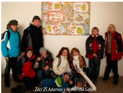
Žáci ZŠ Adamovi v blanenské Galerii