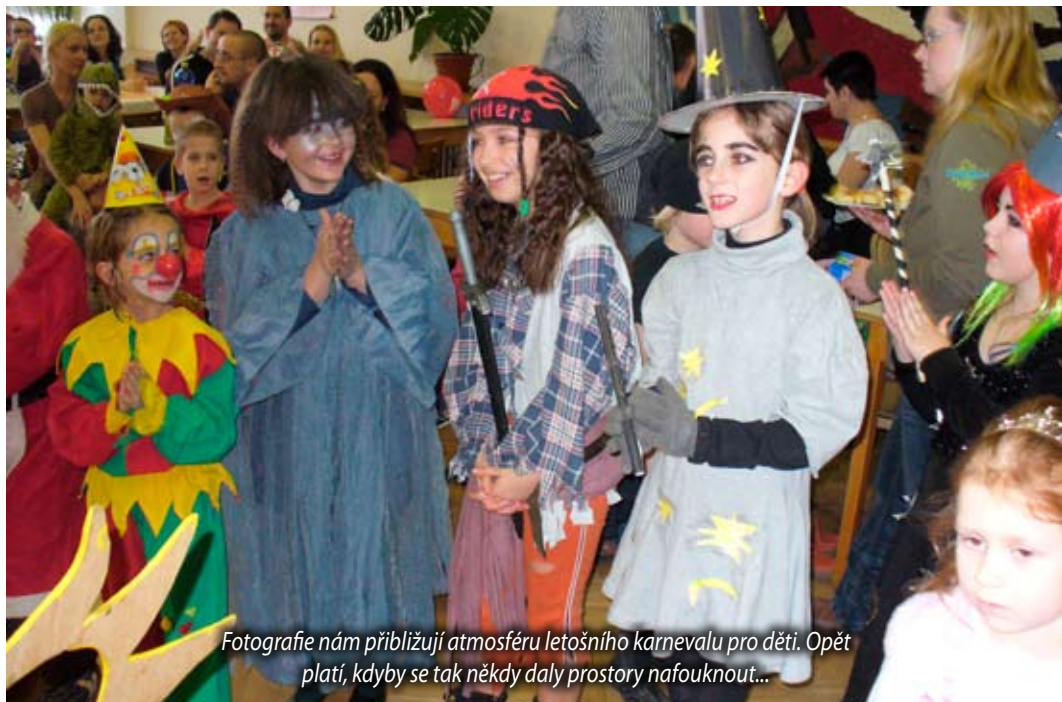
Fotografie nám přibližují atmosféru letošního karnevalu pro děti. Opět platí, kdyby se tak někdy daly prostory nafouknout...