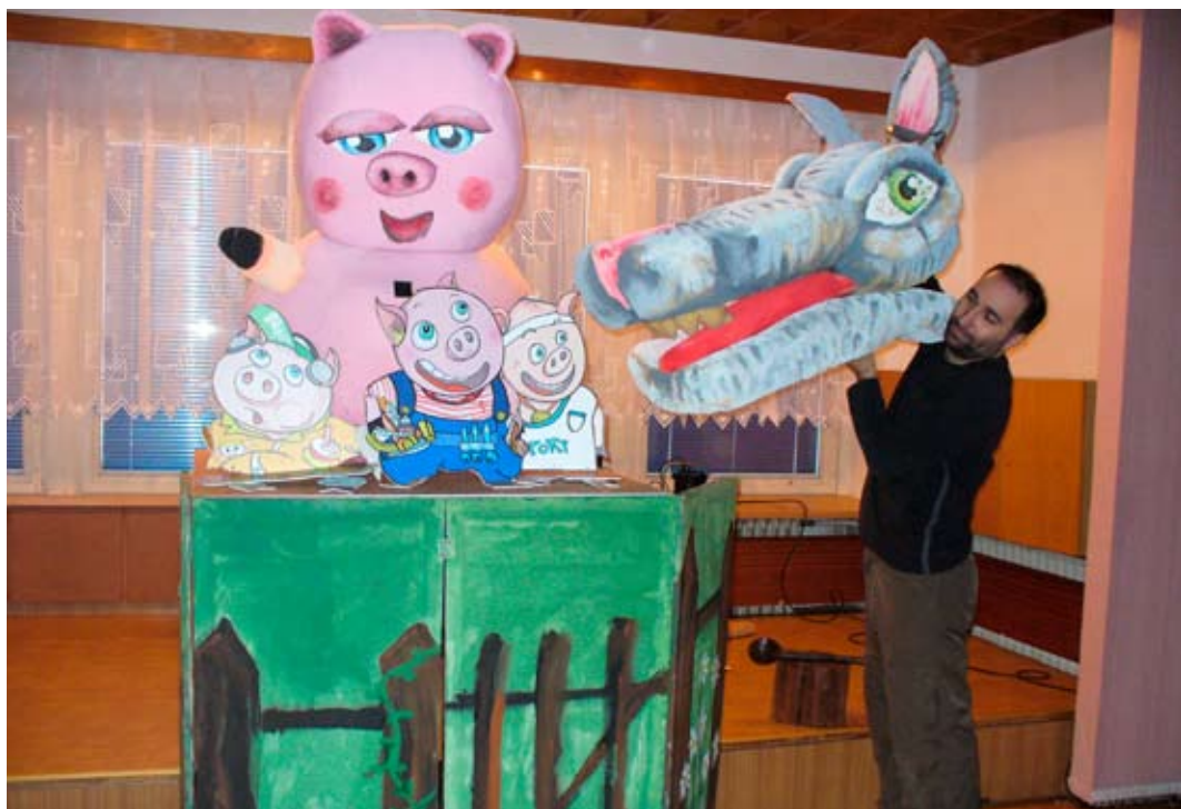
Agentura Koráb - herec Radim Koráb dětem v rámci akce „Dopoledne s pohádkou“ zahrál pohádku nazvanou „Pohádka pro tři prasátka“. S herci agentury Koráb se děti setkají i při karnevalu, který je připravován na 14. března t.r.