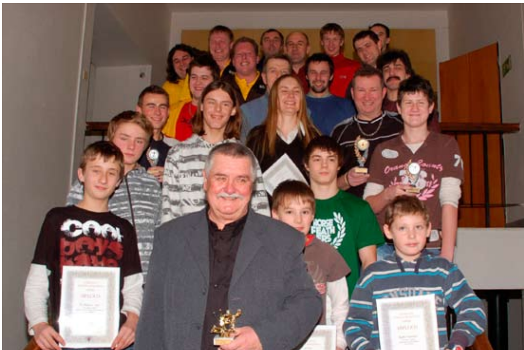
Společné Foto z vyhlášení nejlepšího sportovce roku 2008. Na závěr bychom chtěli poděkovat sponzorům, jmenovitě pivovaru Černá Hora, FK Adamov a Městu Adamov, kteří věnovali hodnotné dary pro vyhodnocené kandidáty.