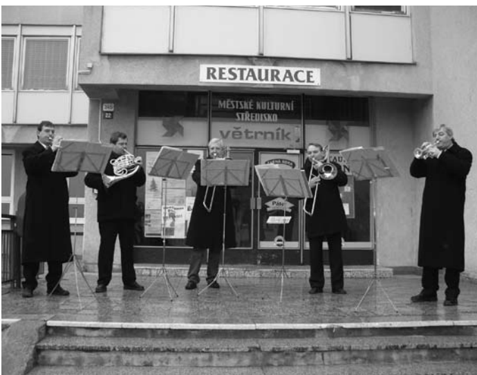
Vánoční trubači všem zájemcům opět zpríjemnili Štědrý den roku 2008 svým vystoupením.