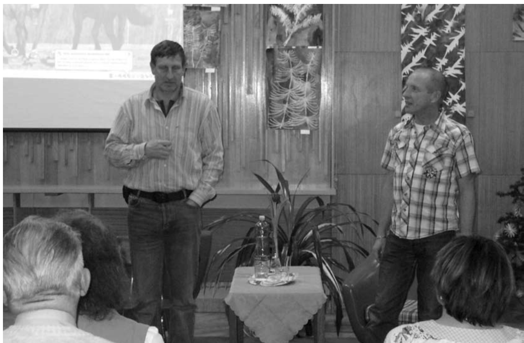
„Na slovíčko s Václavem Vydrou“ vás pozvalo MKS 12. ledna t.r. V téměř dvouhodinovém povídání nezapomněl Václav Vydra vzpomenout na svoji maminku - skvělou herečku Danu Medřickou, na účast v taneční soutěži, ale nejvíce prostoru, včetně krátkého filmu, patřilo jeho velké lásce - koním.