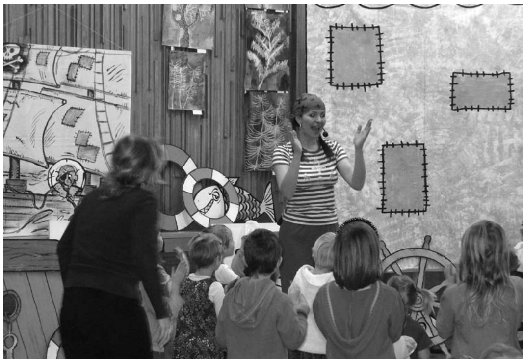
„Velká kamarádka malých i velkých dětí - Míša“ našla ve svém (do posledního místečka zaplněném) diáři s termíny vystoupení prostor i pro adamovské děti. A tak se ze sálu MKS 8. ledna nesl smích a známé a veselé písničky. S Míšou děti tancovaly a soutěžily.