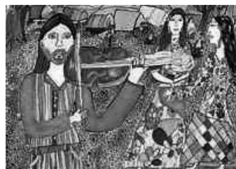
Tradiční romský tanec