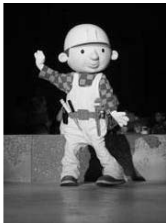
Fotografie z koncertu Jožky Šmukaře a jeho přátel, který se konal 22. září t.r. v MKS

MKS připravuje na tuto ojedinělou akci autobusový zájezd, cena zájezdu je 485 Kč. Jedno dítě do 100 cm výšky může sedět dospělě osobně na klíně. Přihlášky ihned.