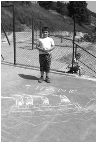
Malování na chodníku si v pátek odpoledne užily děti ze školní družiny.