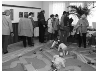
Ještě k výstavě Jsme na jedné lodi...

obnova turistických tras, údržba informačních objektů.