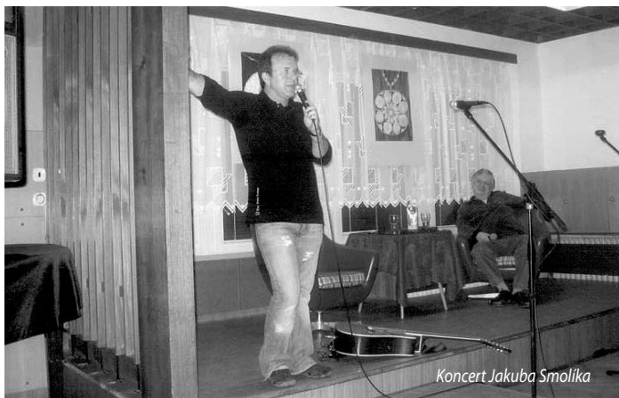
Koncert Jakuba Smolíka